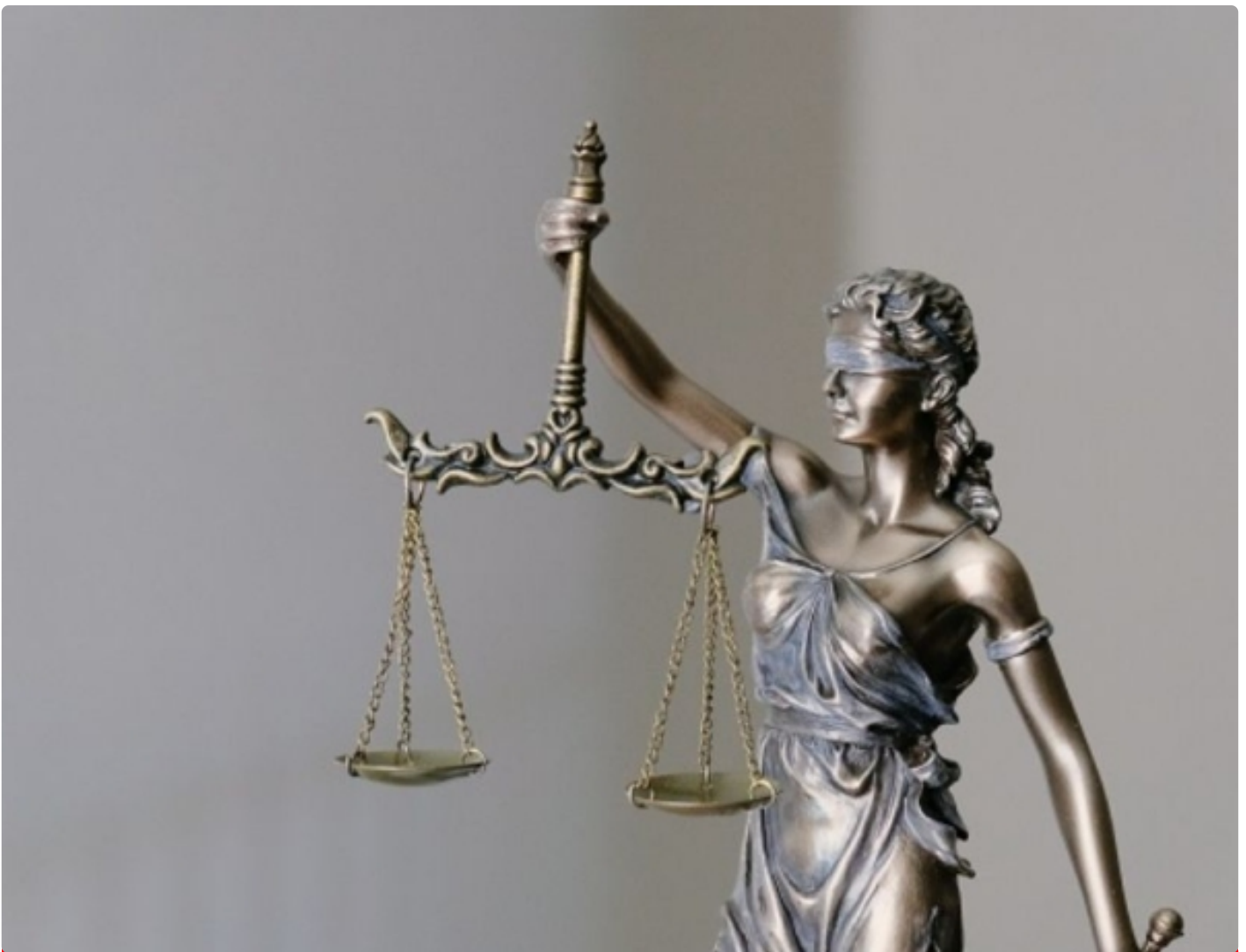
Gambar Ilustrasi Dewi Keadilan